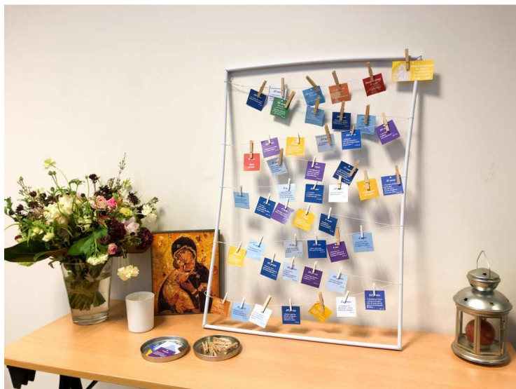
Ilyen lesz a naptárunk

Az Érsekség otthon készíthető nagyböjti naptárt ajánl a híveknek. Az elkészítése könnyű és szórakoztató, felnőtteknek és gyerekeknek egyaránt kellemes időtöltés. Minden napra van egy kis lap, amelyen egy-egy mondat szerepel. Ez lehet idézet az evangéliumból, egy zsoltárból, vagy az aznapi olvasmányból. Kiváló segítség ahhoz, hogy megerősített hittel éljünk a nagyböjti időszakban. A naptárról bővebben : www.paris.catholique.fr/calendrier-de-careme-2021.html