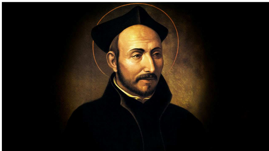
Loyolai Szent Ignác