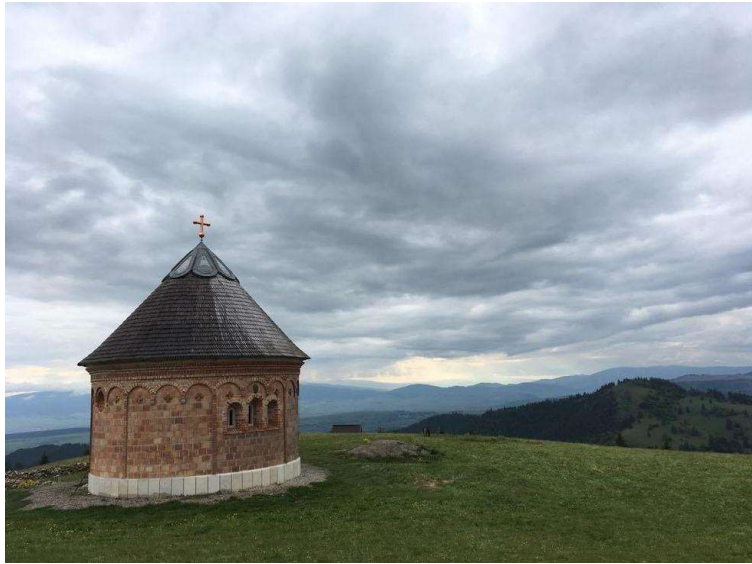
Az erdélyi Széphavas Szentlélek kápolna