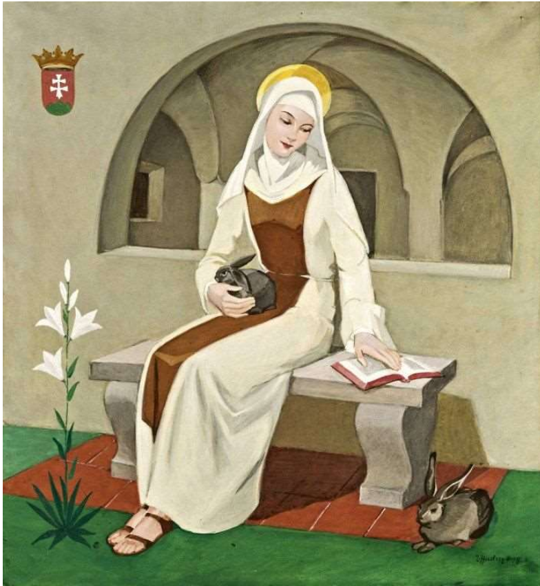
Árpád-házi Szent Margit (1242-1270)