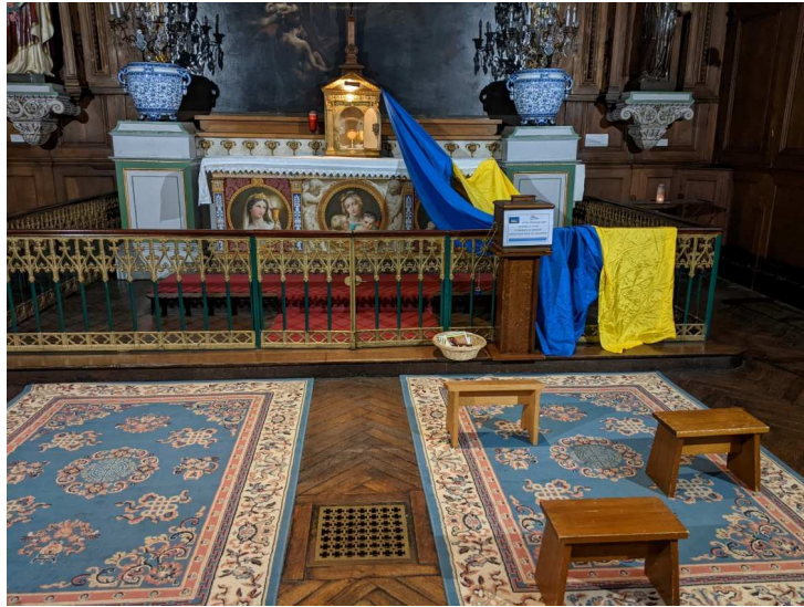
A Sainte Elisabeth de Hongrie templom kápolnája