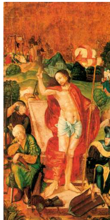
Esztergomi Keresztény Múzeum M.S. mester : Feltámadás

Adjatok hálát s virágot, tömjént hozzatok. Hallelujah! hallelujah! Zengje ajkatok. Mert feltámadtok ti is még valamennyien Mint az istenember egykor: Győzedelmesen