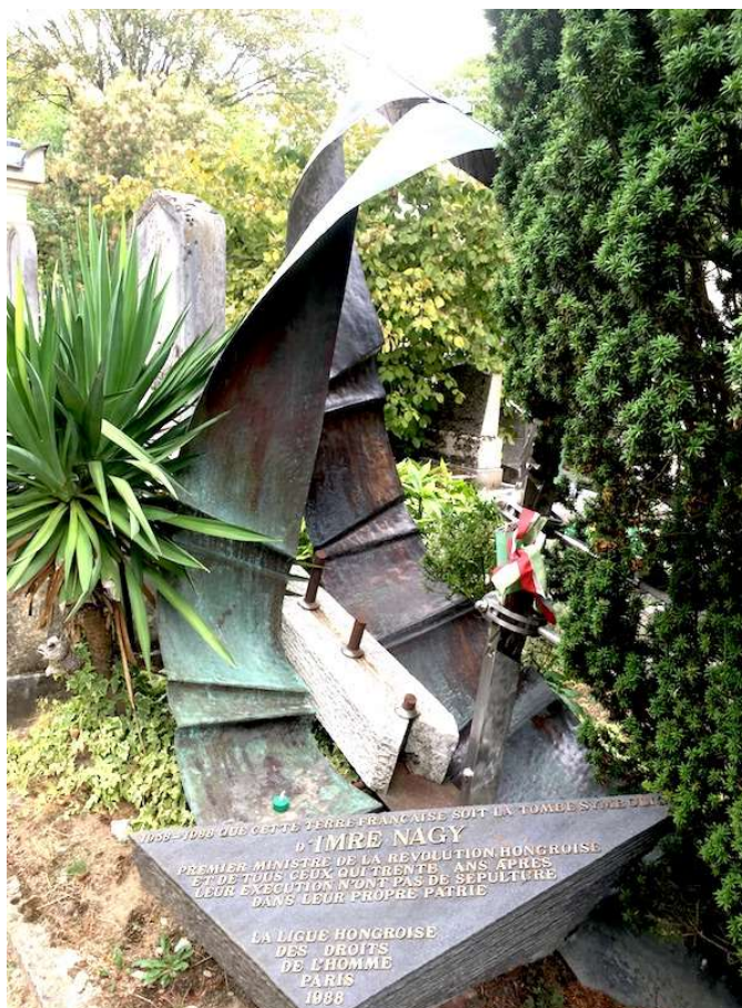
Emlékmű a Père Lachaise temetőben

Ezen a napon, az 1956-os forradalom és szabadságharc elfojtásának és a szovjet csapatok egykori bevonulásának 66. évfordulóján, 11 órakor a Père Lachaise temetőben (Division 44) emlékezünk a mártírokra Nagy Imre miniszterelnök és az összes kivégzett szabadságharcos emlékművénél