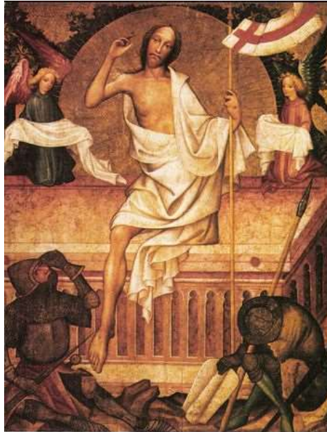
Kolozsvári Tamás A feltámadás , 1427.