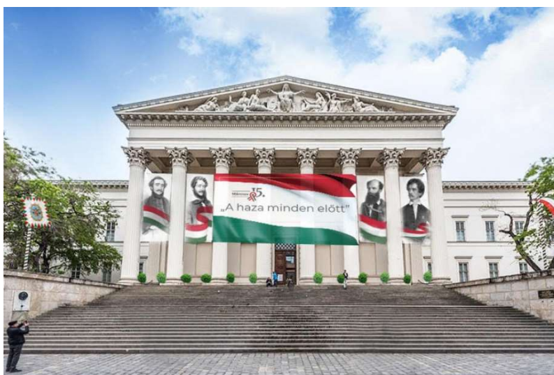
„A haza minden előtt” - Kölcsey Ferenc (1790-1838)

1848. március 15-én robbant ki Pesten a radikális ifjúság által vezetett forradalom, nyitányát adva Magyarországnak másfél éves szabadságküzdelmének.