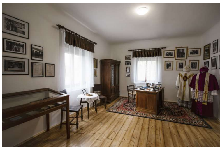
A Baranyaszentgyörgyön 2022 áprilisában felavatott UHL ANTAL-emlékszoba